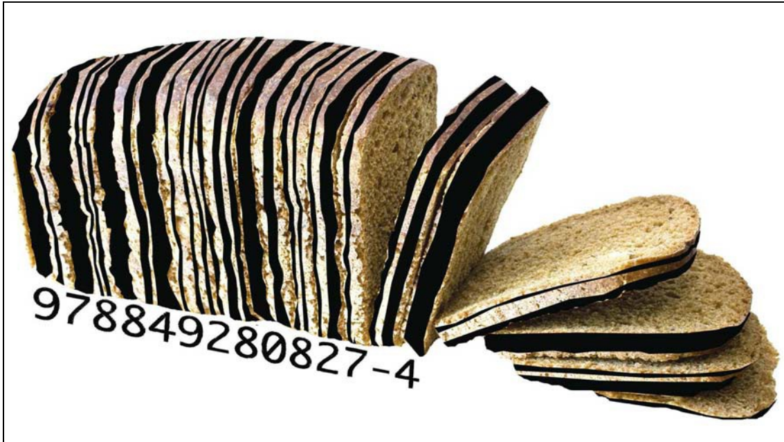
Obra: "Barra" Autor: Ibérico

función de cambio" para derivarlo decididamente a la esfera de la "función de uso". La obra de arte se sale del mercado y se transforma en un instrumento de diálogo, en producto de comunicación. Tal la revolución del Arte Correo. Una construcción cultural y artística que apunta al corazón del sistema al obstruir lo que lo mantiene unido, el dinero. Y, también, al negar su estructura, el mercado. Y su consecuencia, el consumismo.